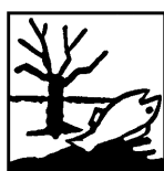
Niebezpieczny dla środowiska

Działa drażniąco na drogi oddechowe i na skórę.