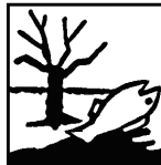
Niebezpieczny dla środowiska

Działa szkodliwie przez drogi oddechowe.